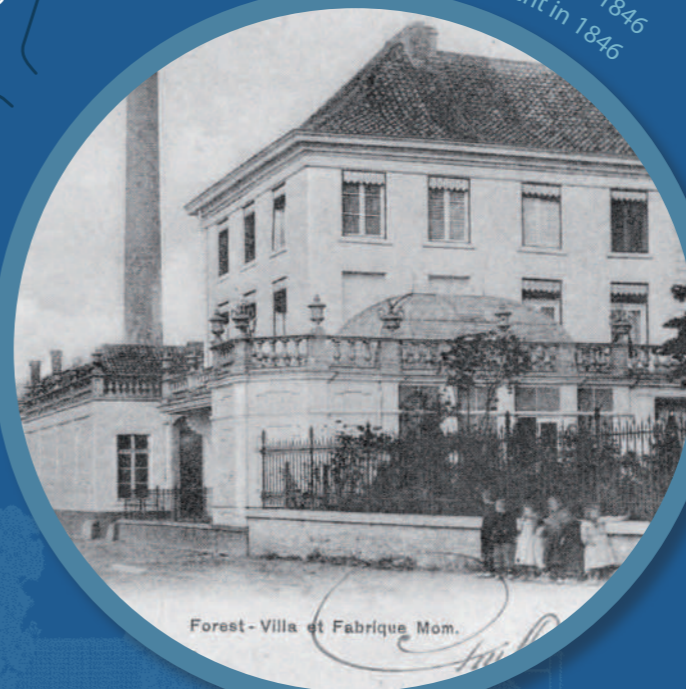
Forest - Villa et Fabrique Momm.

La Teinturerie Momm créée en 1846 Ververij Momm opgericht in 1846